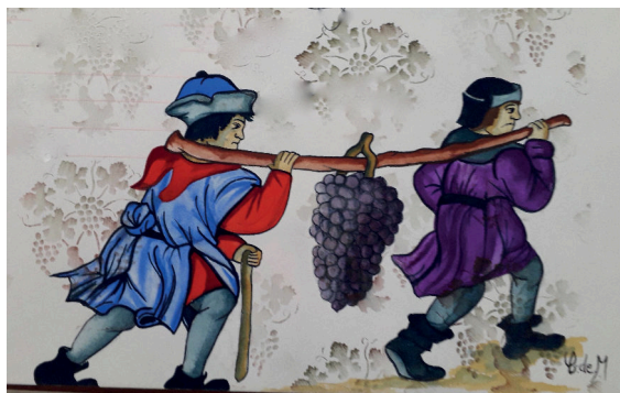
Enluminure - Livre d'or de la Confrérie - Institut Européen d'Enluminure d'Angers- Barbara Demonchy

Créée en 1904 dans les caves du château de Montreuil-Bellay, la Confrérie des Chevaliers du Sacavin est la plus ancienne confrérie bachique de France. Installée à Angers depuis 1947, elle défend sans relâche la typicité et la qualité des vins de nos terroirs ainsi que le patrimoine culturel de la Province Angevine.